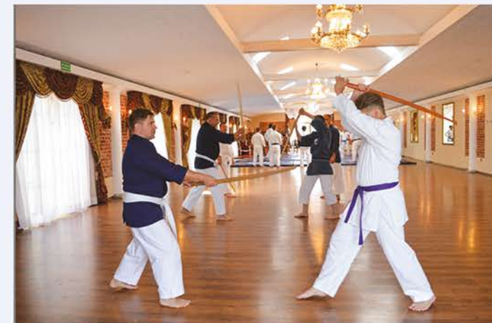
Reichlich Platz für jede Action.