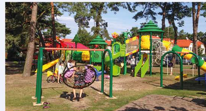
Spaß für die Kleinen im Freizeitpark auf dem umzäunten Gelände. Auf die Erwachsenen warten Disco und Shoppingcenter in der Nähe.