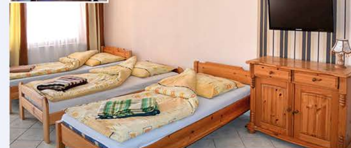
Ob Einzel- oder Mehrbettzimmer: alle Unterkünfte sind mit Bad und WC ausgestattet.