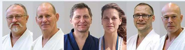
Sensei Büki Karate, Kenjutsu